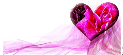
Muttertag - Bild von Bru-n0 auf Pixabay

08:00 Uhr Hl. Messe für verstorbene Mitglieder 09:00 Uhr Mutter- und Vaternachtsfeier im Pfarrsaal