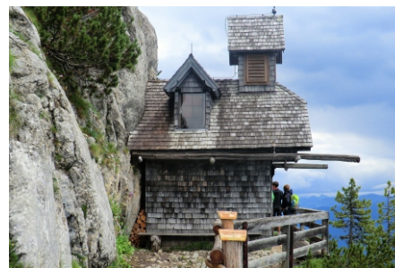
Stoderkirchlei Stoderzinken Schladming Gröbming AT