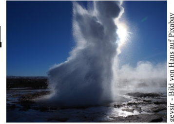
geysir