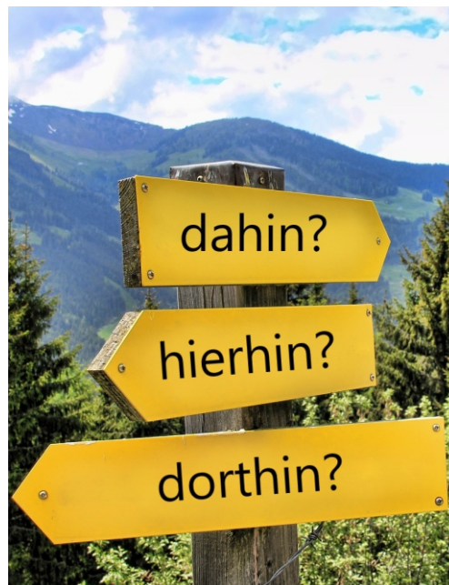
Wegweiser Landschaft beschreiben Fahrt ins Blaue

inkl. Leistungen: Busfahrt, Strecke laut Programm div. Eintritte Mittagessen vom Buffet