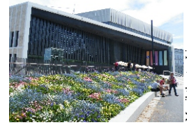
Musiktheater Linz