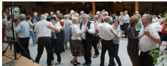
Seniorentanz 2017